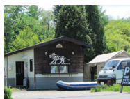
ライオン千歳ベース