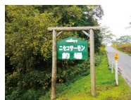
リバーフィッシング振替え釣り堀