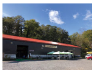
ライオンニセコベース