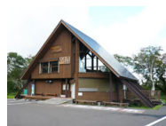
神仙沼駐車場内レストハウス