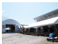
ライオンリバーベース