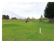
パークゴルフ場(ニセコ町)